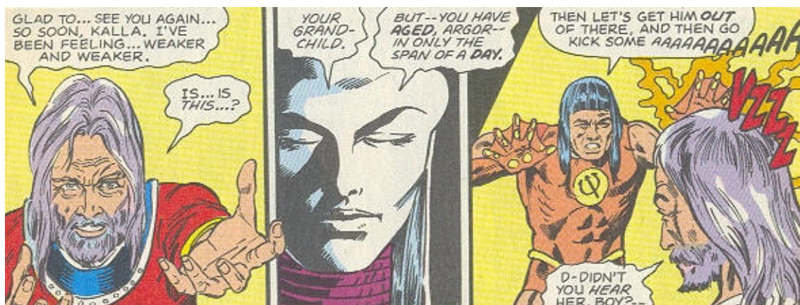
The Young All-Stars numéro 17, p. 21

bénéficier de la technologie du Vrill). Ni Ross, ni Miriam n'en avait la moindre idée : les SS les assassinèrent sauvagement. Neptune Perkins se retrouva orphelin, nous sommes en 1942 et les Young All-Stars peuvent entrer en scène.