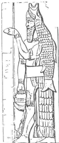
Représentation d'un Planificateur de type Abgal, tablette sumérienne ( La douzième planète , chapitre 10, p. 298)

cette Énergie indispensable. Ils nous utilisent donc comme des réservoirs énergétiques, et nous élèvent en tant que tels (de la même manière que nous élevons des animaux domestiques pour leur lait, viande). Lorsque l'homme fut prêt, les Annunaki l'utilisèrent comme prévu en tant qu'esclave. Mais les hommes devinrent de plus en plus nombreux, et les Annunakis finirent par disparaître (volontairement dans des vaisseaux spatiaux ? déluges bibliques ? Lémurie ? Atlantide ? à la suite de guerres contre les humains ?)